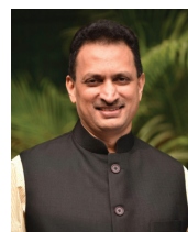
Шри Анант Кумар Хедж, Министр по развитию навыков и предпринимательства Shri. Anant Kumar Hegde, Honourable Union Minister of State for Skill Development and Entrepreneurship