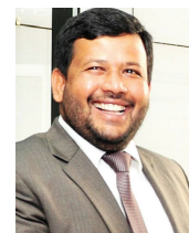
Абду Ришад Батхиудин, Министр промышленности и коммерции Шри Ланка Abdu Rishad Bathiudeen, Honourable Minister of Industry and Commerce of Sri Lanka