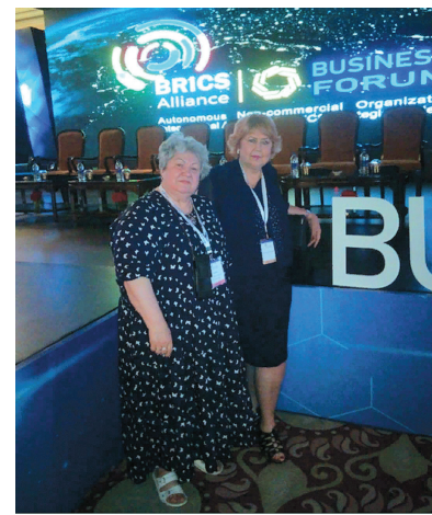
Forum of the BRICS Alliance:

For creation projects specified in the Resolution, their promotion and effective implementation in BRICS and other countries it is recommended to the Organizing Committee of the