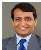
Суреш Прабху, Министр коммерции, промышленности и гражданской авиации Suresh Prabhu, Honourable Minister of Commerce, Industry and Civil Aviation