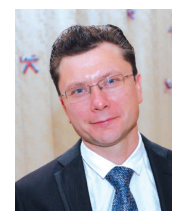
Роман К. Бабушкин, временный поверенный в делах посольства России в Индии Roman K. Babushkin, Charge-de-affairs, Embassy of the Russian Federation