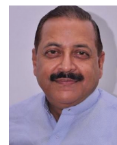
Д-р Джитендра Сингх, Министр по развитию Северо-Востока страны Dr. Jitendra Singh Honourable Minister of State for Development of North Eastern Region